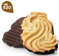
SABLÉS VIENNOIS 32 étuis de 2 - 820 g DDM* : 2 mois