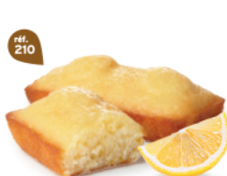
FONDANTS CITRON 30 emballages individuels - 660 g DDM* : 2 mois