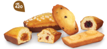
BOUQUET DE PÂTISSERIES 30 emballages individuels - 850g 5 Madeleines Pépites - 5 Génois Chocolait - 5 Bijou Caramel Chocolait 5 Bijou Myrtille - 5 Financiers Amandes - 5 Cakes Fruits DDM* : 2 mois