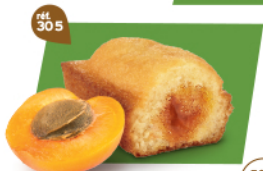
BIJOU ABRICOT 20 emballages individuels - 680 g DDM* : 2 mois