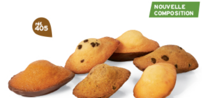
FARANDOLE DE MADELEINES 30 emballages individuels - 575 g 5 Madeleines Chochoir - 5 Madeleines Pépites - 5 Madeleines Citron - 5 Madeleines ChochoPistache - 5 Madeleines Noix de coco Pépites - 5 Madeleines Caramel Chocolait DDM* : 2 mois