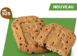
P'TIT-DEJ CHOCOCROUSTILL' 24 étuis de 2 - 670 g DDM* : 5 mois