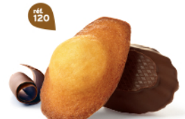
MADELEINES CHOCHOIR 50 emballages individuels - 1080 g DDM* : 2 mois