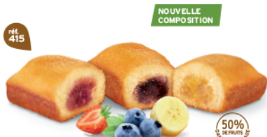
PANACHÉ DE BIJOU FRUITS 30 emballages individuels - 900 g 10 Bijou Fraîse, 10 Bijou Myrtille, 10 Bijou Banane DDM* : 2 mois