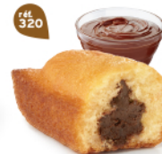
BIJOU CACAO 20 emballages individuels - 680 g DDM* : 2 mois