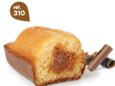
BIJOU CARAMEL CHOCOLAIT 20 emballages individuels - 740 g DDM* : 2 mois