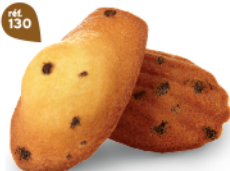
MADELEINES PÉPITES 50 emballages individuels - 900 g DDM* : 2 mois