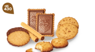
MÉLI-MÉLO DE BISCUITS 48 étuis de 2 - 900 g 8 étuis de 2 Rolinettes Chochoisettes - 10 étuis de 2 Craquants Cocolait 10 étuis de 2 ChocoSablés - 10 étuis de 2 Galettes Caramel d'Irigny 8 étuis de 2 Petit-Bonheur Tablette Chocolat DDM* : 5 mois