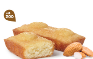
FINANCIERS AMANDES 30 emballages individuels - 660 g DDM* : 2 mois