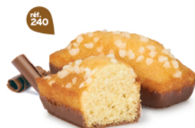
GÉNOIS CHOCOLAIT 30 emballages individuels - 920 g DDM* : 2 mois