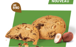
TRÉSOR NOISETTECHOCO 18 étuis de 2 - 585 g DDM* : 5 mois