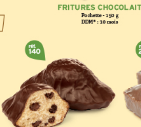
FRITURES CHOCOLAIT Pochette - 150 g DDM* : 10 mois