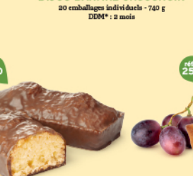
BIJOU BANANE CHOCHOIR 20 emballages individuels - 740 g DDM* : 2 mois