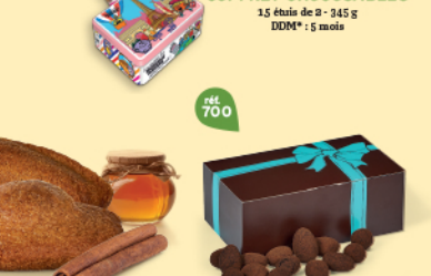
COFFRET CHOCOSABLÉS 15 étuis de 2 - 345 g DDM* : 5 mois