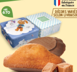
COFFRET MADELEINES CARAMEL CHOCOLAIT 18 emballages individuels - 390 g DDM* : 2 mois