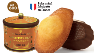
BOÎTE COLLECTOR MADELEINES CHOCHOIR 18 emballages individuels - 280 g DDM* : 2 mois