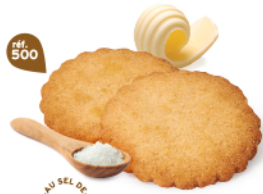
GALETTES 48 étuis de 2 - 880 g DDM* : 5 mois