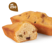
CAKES FRUITS 20 emballages individuels - 600 g DDM* : 2 mois