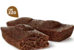
MOELLEUX CHOCOLAIT 30 emballages individuels - 960 g DDM* : 2 mois