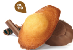
MADELEINES CHOCOLAIT 50 emballages individuels - 1080 g DDM* : 2 mois