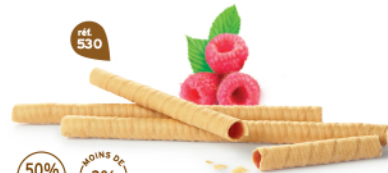
BRINS FRAMBOISE 7 étuis de 2 - 435 g DDM* : 5 mois