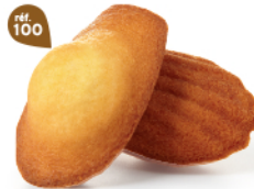
MADELEINES NATURE 50 emballages individuels - 880 g DDM* : 2 mois