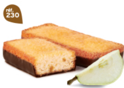
LINGOTS POIRE CHOCHOIR 25 emballages individuels - 675 g DDM* : 2 mois