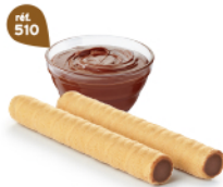
ROLINETTES CHOCHOISSETTES 45 étuis de 2 - 575 g DDM* : 5 mois